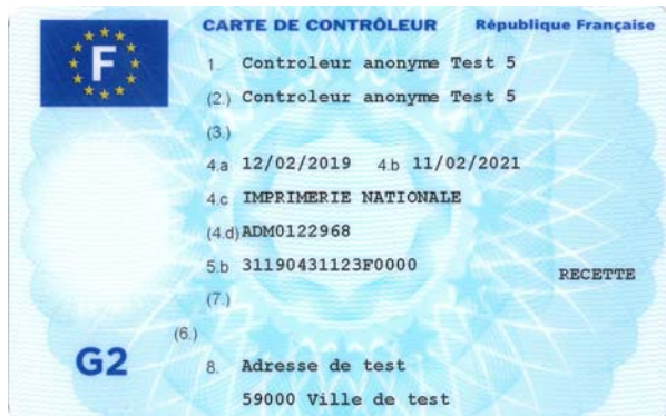
Carte de contrôleur (personne morale)