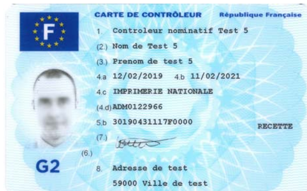
Carte de contrôleur (personne physique)