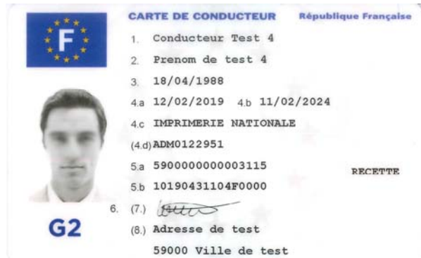
Carte de conducteur