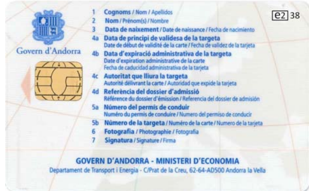
Carte de conducteur