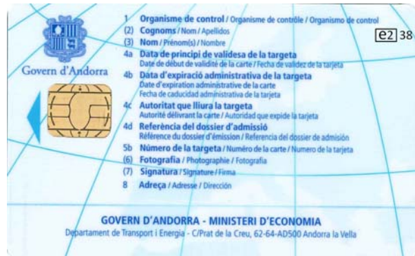
Carte de contrôleur (personne morale)