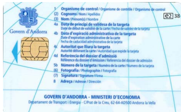
Carte de contrôleur (personne physique)