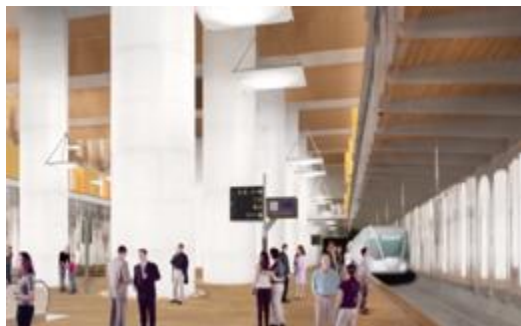
Gare CNIT – La Défense

Le Grand Prix est décerné au consortium composé du Groupe setec associé à l'Agence Jean-Marie Duthilleul avec AREP et Antea Group pour la réalisation du projet EOLE Prolongement du RER E vers l'Ouest – Gare La Défense sous le CNIT – Maitrise d'ouvrage SNCF Réseau